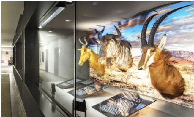
Afrika-Flur mit Trophäensammlung